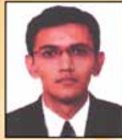
HARESHBHAIVARU MOCK TEST