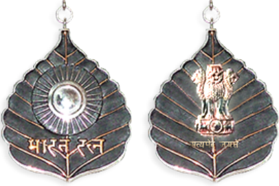
Bharat Ratna Award Bharat Ratna Award (Reverse Side)